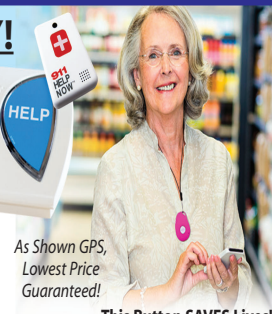
This Button SAVES Lives!